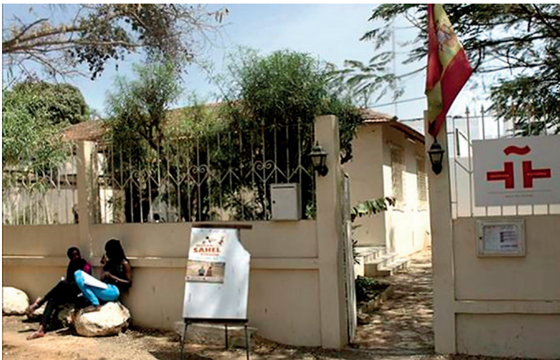
Aula Cervantes en Dakar (Senegal).

El Instituto Cervantes y la Agencia Española de Cooperación Internacional para el Desarrollo (AECI) formarán a profesores de español en cinco países del África Subsahariana