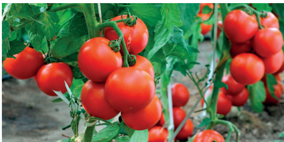
Se cultiva en todo el mundo, más de cien millones de toneladas anuales.

A Europa llega en el siglo XVI procedente de México y al principio se cultiva como ornamental. Su cultivo intensivo no se da hasta finales del siglo XIX. Desde el tomate clásico de ensalada hasta las salsa de tomate hay infinidad de procesados,