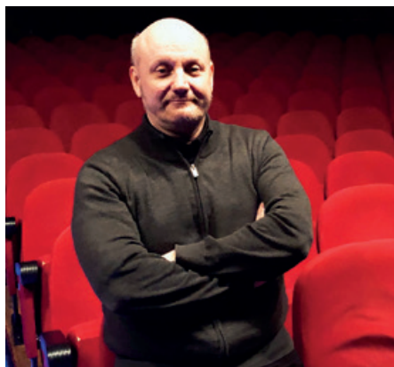
Juan José Campanella.

Para Campanella, la manera más fácil de explicar el encuentro de los dos ancianos es la de la relación entre Don Quijote y Sancho: “Es como si los dos personajes de Cervantes se encontraran en El Retiro y se llevan mal porque tienen diferentes visiones del mundo. Uno es un personaje luchador, que se resiste y que quiere cambiar el mundo, y el otro es un portero de un edificio de noche que trata de pasar desapercibido y de aprovecharse del mundo tal cual es, son visiones filosóficas diversas”.