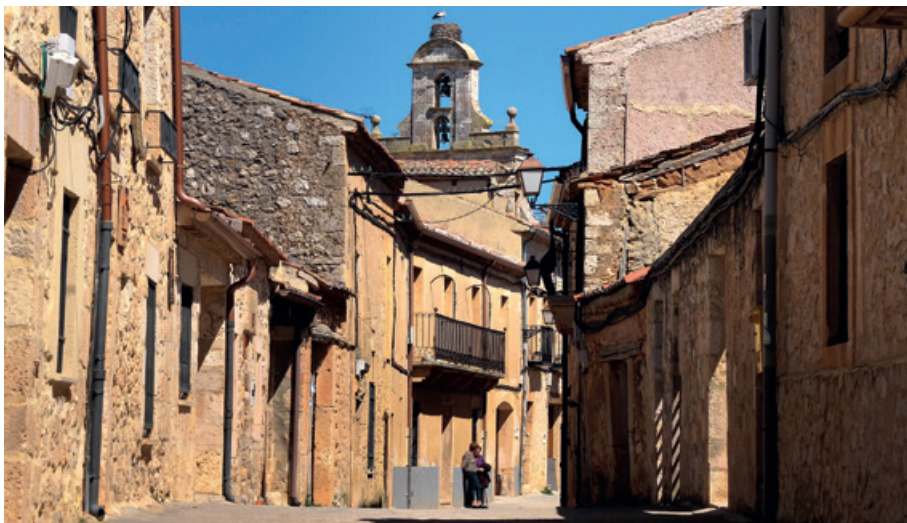
Maderuelo acumula vestigios arquitectónicos y mucha historia.

de la hoz del embalse queda la Ermita de la Vera Cruz, fabricada a calicanto en el Medioevo y declarada monumento ya en 1924. Los frescos románicos que cubren sus paredes y techos son copia de los originales que en 1947, amenazados por el embalse, se trasladaron al Museo del Prado y algunos lectores de cierta edad los recordarán de la enciclopedia de su infancia.