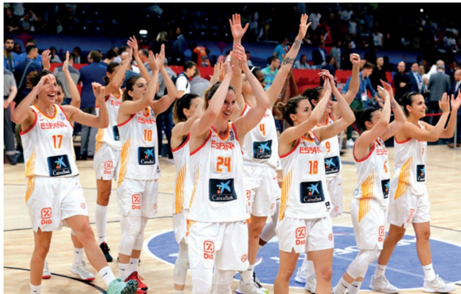
C. PIERA Las españolas ovacionan al público tras la final.

La selección española con el oro europeo al cuello (y van cuatro) ya tiene en mente el próximo reto: los Juegos Olímpicos de Tokio en 2020 y allí estará su principal bestia negra: Estados Unidos.