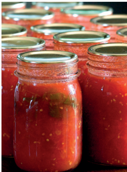
El tomate en conserva es la madre de todas las salsa de tomate.