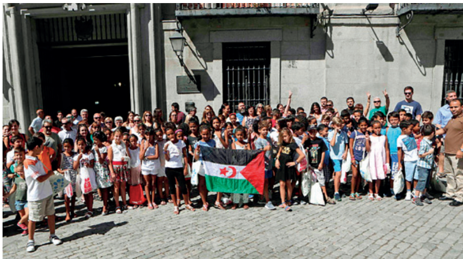
España ha acogido en vacaciones a más de 27.000 niños saharauis entre 2013 y 2018.

La distribución territorial prevista de los niños que vendrán en 2019 es la que se detalla, por Comunidades Autónomas, en el cuadro adjunto. ☒