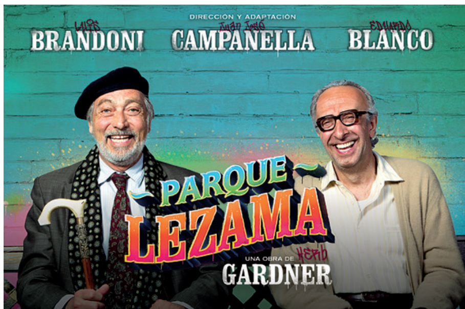
Cartel anunciador de Parque Lezama con Luis Brandoni y Eduardo Blanco.

Un encuentro entre dos octogenarios de ideología radicalmente opuesta en un banco del parque Lezama de Buenos Aires -originalmente Central Park- sirve para contraponer la diatriba personal de cómo posicionarse ante la vida, por