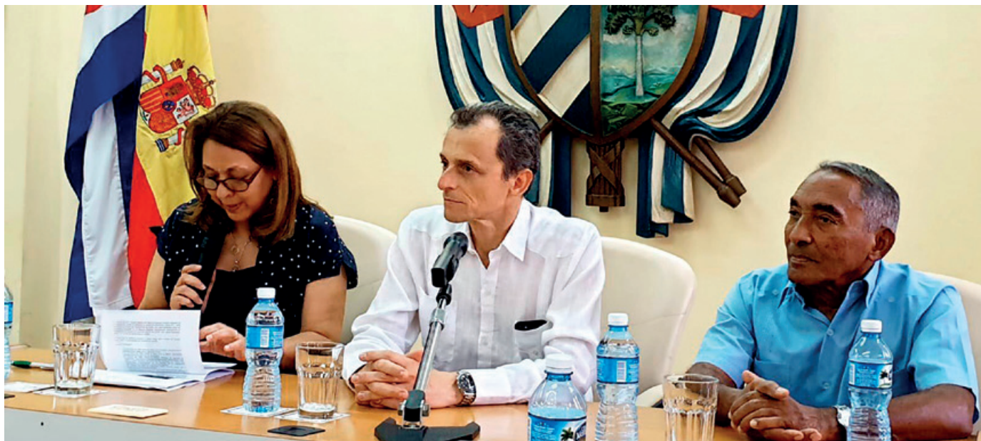
El ministro Pedro Duque junto a autoridades cubanas.

España y Cuba han firmado un acuerdo para reforzar la colaboración en materia científica y de educación