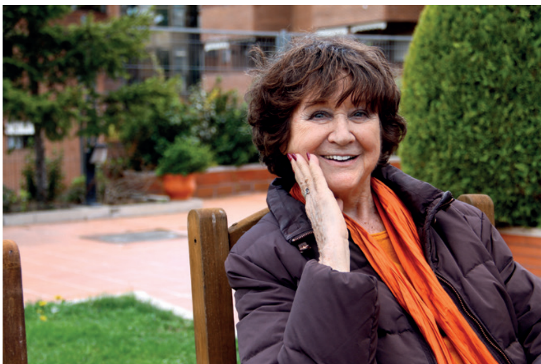
Julietta Serrano es una de las actrices con más recorrido en teatro y cine.

No fue ni Pepi, Luci, Bom, ni tampoco una chica del montón , pero ya estaba en la que fue la primera película comercial de Almodóvar