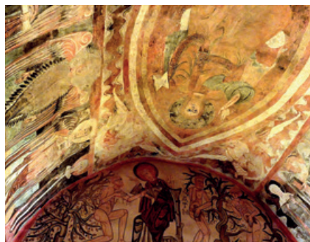
Frescos románicos de la ermita de la Vera Cruz.