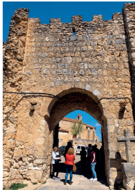
Puerta de la muralla.