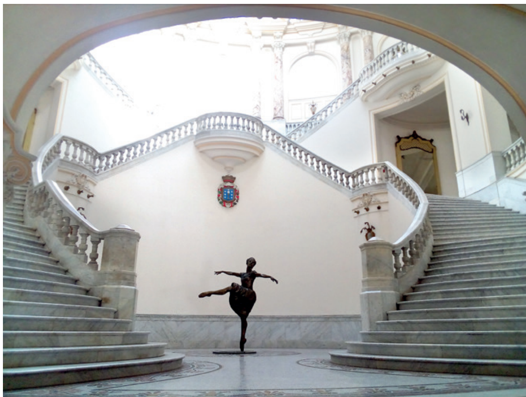
Estatua de Alicia Alonso al pie de la escalinata.

Historia y belleza juntas en este edificio maravilloso donde en 1907 se cantó por primera vez en Cuba el himno gallego . Con nuevo nombre acordado en septiembre de 2015, la casa de la danza en La Habana otra vez con sus puertas abiertas desde enero de 2016