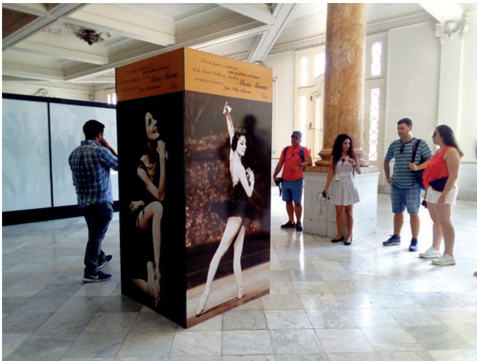
El Gran Teatro fue hasta 1985 el Centro Gallego de La Habana.

En sus salas se presentan óperas, zarzuelas, operetas y conciertos, interpretaciones del Ballet Español de Cuba y del Centro de Promoción de la danza (PRODANZA) Y acoge frecuentemente las funciones del Ballet Nacional de Cuba, bajo la dirección de la prima ballerina assoluta Alicia Alonso, homenajeada en el año 2015 con la elección de su nombre para denominar al Gran Teatro.