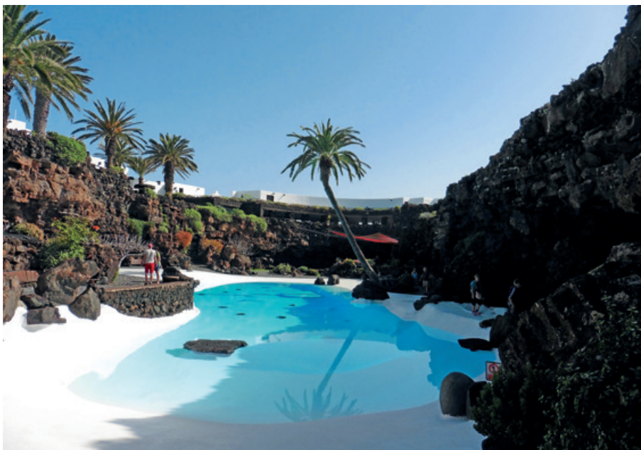
“Jameos del agua” una de las obras principales de César Manrique.

Aquí, casi sin quererlo, empezó su campaña de sensibilización para que los isleños valorasen y respetasen el estilo tradicional arquitectónico de su tierra. Pronto chocó con los intereses de los empresarios del ladrillo que en los años 70 comenzaban a vivir su “boom” y se radicalizaría hasta colocarse codo