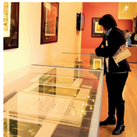
Detalle de la exposición.