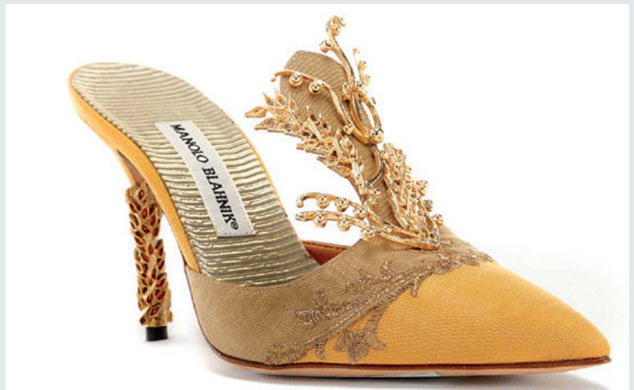
Modelo Olvida inspirados en el retrato Madame de Pompadour de Boucher.