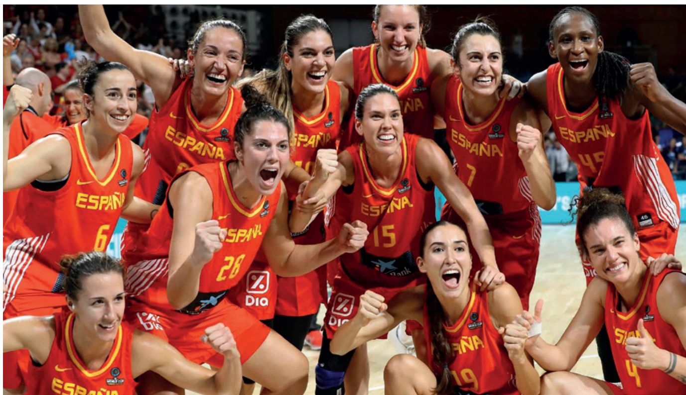
Las campeonas exultantes.

La MVP (Jugadora más valorada) del campeonato fue la española de origen senegalés Astou Ndour, una pivot de 1,98 que acaba de cumplir 25 años y que tiene una progresión meteórica desde que llegó a Las Palmas con catorce años y no aguantaba los entrenamientos porque estaba anémica. Hoy juega en la WNBA (la liga femenina estadounidense) donde ha sido la jugadora más joven en debutar con 19 años, antes había pasado por la liga turca y la italiana.