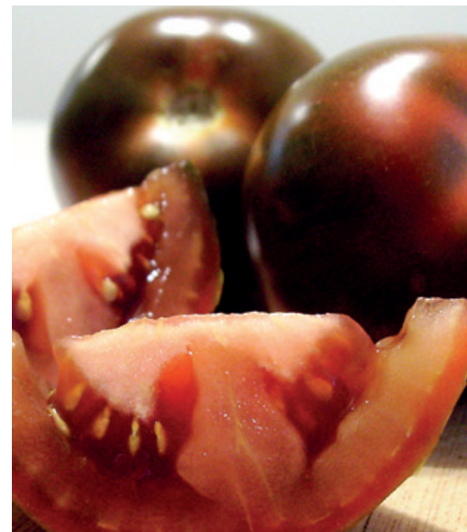
Una de las últimas variedades: el kumato, oscuro, sabroso y dulzón.

sabroso, de pulpa prieta y muy de moda hace unos años. El tomate clásico de ensalada del que existen infinidad de variedades. Son rojos, redondos y achatados, con un tamaño a partir de los 70 u 80 mm. Finalmente tenemos el llamado corazón de buey; tomates gigantes de unos 250 gr o más la unidad, más escasos de pulpa por lo que se utilizan a menudo para rellenar. El tomate de pera,