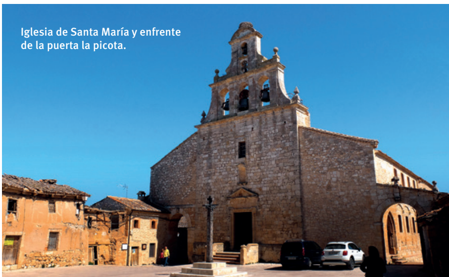
Iglesia de Santa María y enfrente de la puerta la picota.