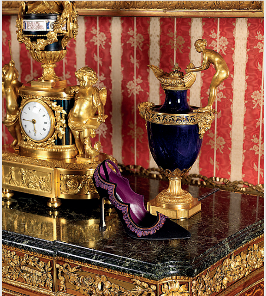
Manolos expuestos entre objetos de la colección Wallace.