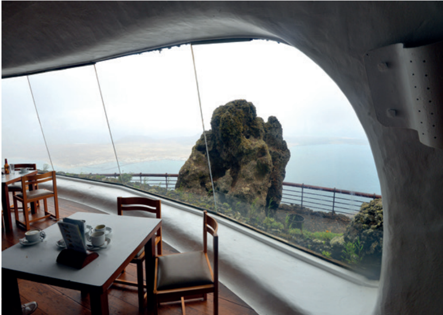
“El mirador del río” otra de las obras colosales de Manrique.