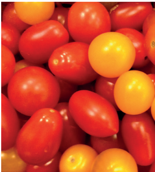
Hoy proliferan los minitomates, de todas las variedades, colores y formas.