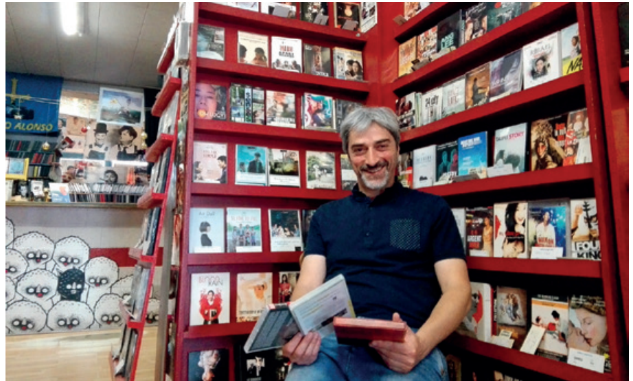
Borbolla salvó Vidéo Express gracias a sus clientes.

Una clientela muy heterogénea que, con altos y con bajos, se ha mantenido a su lado a lo largo de todos estos años