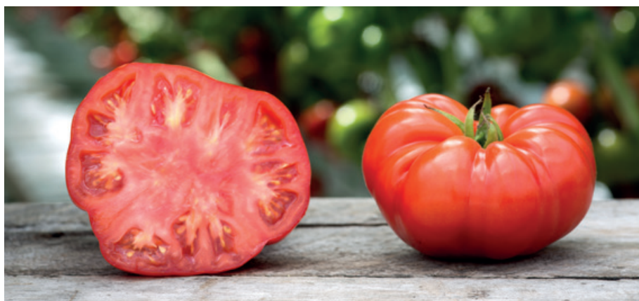
El tomate se desarrolló en México de donde viene su nombre: “xitomatl”.

De menor a mayor tamaño tendríamos el tomate cherry (cereza) de unos 20 mm de diámetro y muy habitual en modernas ensaladas; el tomate de colgar, mallorquín o tomacón en Cataluña, algo más grande, redondo, sobre los 40 mm, de gran duración y que se utiliza sobre todo para untar en el pan. El kumato es una variedad relativamente nueva, se le llama también tomate negro por su tonalidad verde rojo oscuro, está sobre los 50 mm de diámetro y se utiliza para ensaladas destacando su sabor dulzón. El tomate raf creado en las huertas de Almería para contrarrestar la plaga del fusarium (resistencia al fusarium RAF),