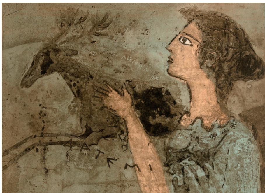
“Artemis” grabado de Dimitri Papageorguii.

El Centro Cultural Conde Duque dedica una exposición antológica a Dimitri Papagueorguii, el artista griego-español conocido fundamentalmente por sus grabados