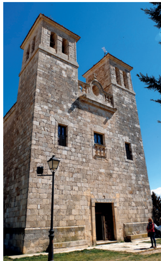
Ermita gigante de Castroboda, que cobija a la patrona de la villa.