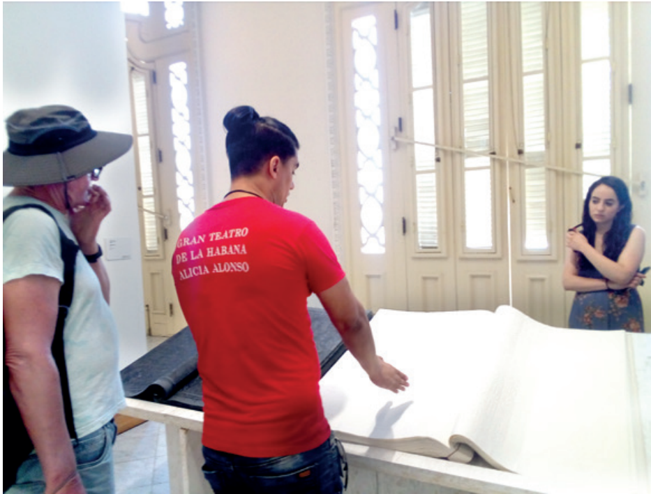
El Gran Teatro de La Habana es un centro cultural de primer orden.

llet de Londres, de la Scala de Milán, el New York City Ballet y del Ballet del Teatro Colón de Argentina, entre otras compañías.