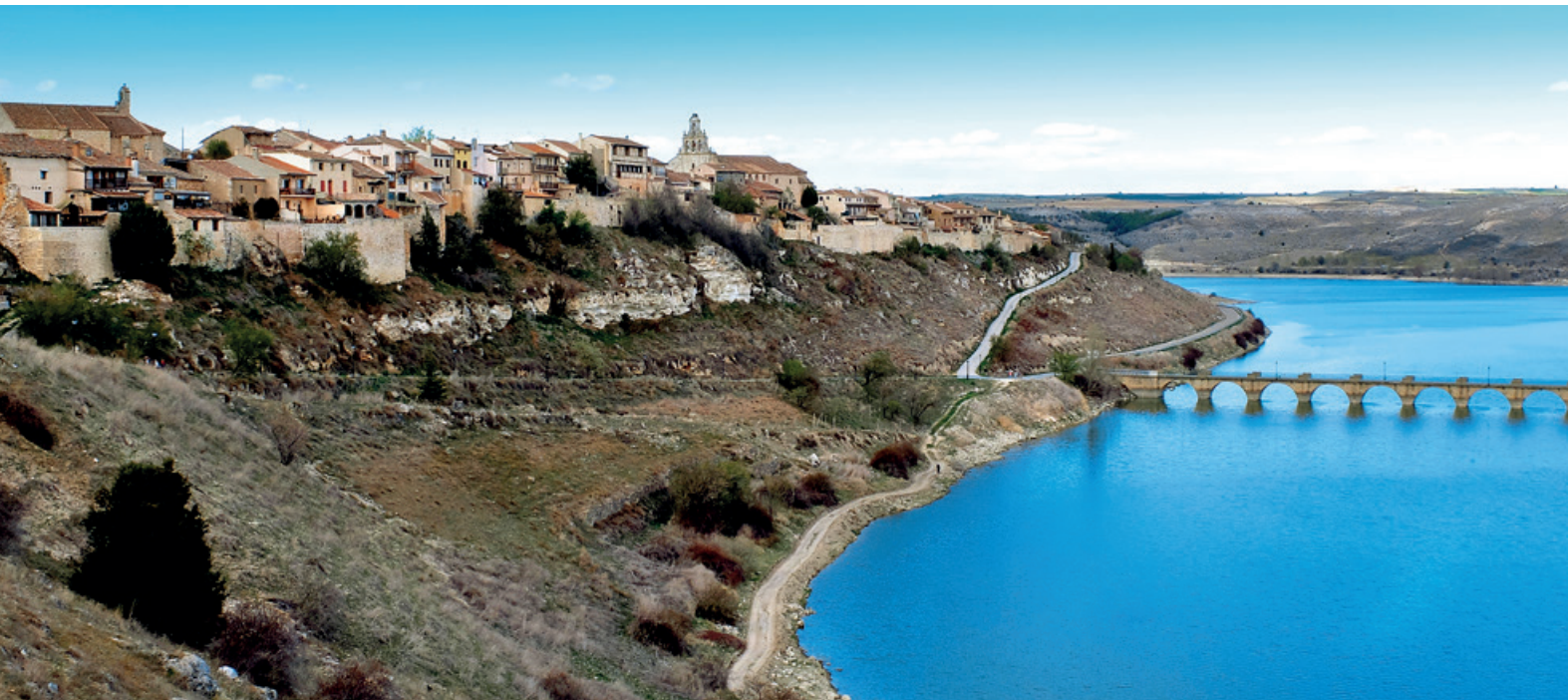
Maderuelo, como un barco varado junto al embalse de Linares.

Visto desde la distancia el pueblo de Maderuelo asemeja un enorme barco encallado junto al Embalse de Linares, un arca de piedra llena de tesoros y cargada de historia