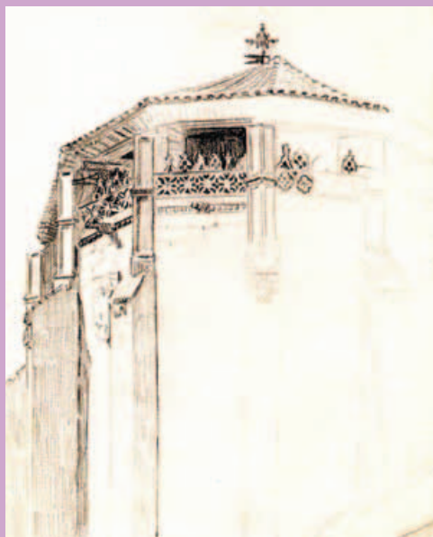
Un rincón salmantino.

Es sabida la querencia del egregio D. Miguel de Unamuno por diversas disciplinas aparte de la literatura, la filosofía y el ensayo político. Fue también aficionado a la papiroflexia (o “cocotología” como el la llamó) y al dibujo. Ahora la Universidad de Salamanca, de la que fue famoso rector ha recogido algunos de sus excelentes dibujos en una exposición montada en el Patio de las Escuelas Menores. Son sobre todo sencillos apuntes a lápiz o carbón de familiares, amigos y rincones de la ciudad castellana en los que nos muestra lo que le era más íntimo y próximo.