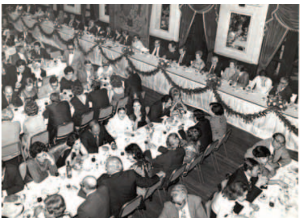
Cena de la Hispanidad de las asociaciones españolas de Puerto Rico. 1987.

Se ha disparado el asociacionismo de los emigrantes españoles: hoy existen más de ochenta asociaciones de españoles en Estados Unidos y Puerto Rico, la última surgida en 2010 en Minnesota.