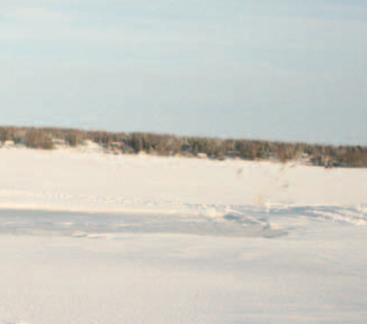
Playas de Åland.

En medio del mar Báltico, entre los bosques cuenta como es su vida en invierno. Llegar a los -27 grados.