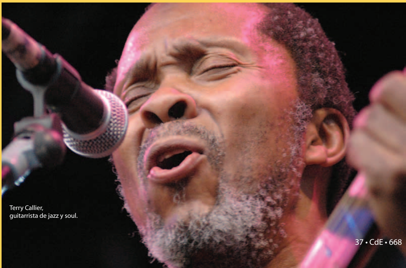
Terry Callier, guitarrista de jazz y soul.