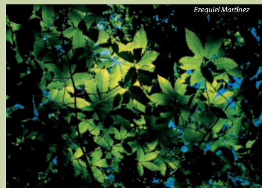
Castañar en Sanabria (Zamora).

las medicinas que consiguen en los bosques. Con la desaparición progresiva de las superficies arboladas se extinguen muchos pueblos indígenas y se pone en peligro la supervivencia de cientos de especies animales. Según fuentes de la FAO, todavía se puede actuar. En este momento, los bosques cubren más del 30 por ciento del planeta y contienen más de 60.000 especies distintas de árboles. Pero es necesario intervenir pronto y con contundencia. El Programa de Naciones Unidas para el Medio Ambiente (PNUMA) exige a los