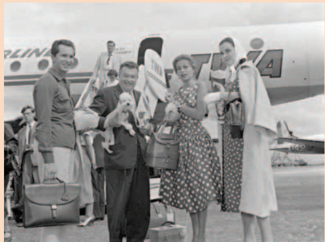
Luis Miguel Dominguín y Xavier Cugat con sus esposas, Abbe Lane y Lucía Bosé

ta Florida, donde la presencia de oficinas de cajas y bancos españoles es ya parte del paisaje urbano.