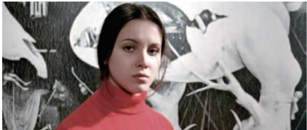
Ana Belén en un fotograma de "Españolas en París". Roberto Bodegas. 1971.

La película daba a conocer aspectos de la emigración de los que no se hablaba entonces en España o en Francia, como el coraje de las jóvenes mujeres que decidieron marchar solas