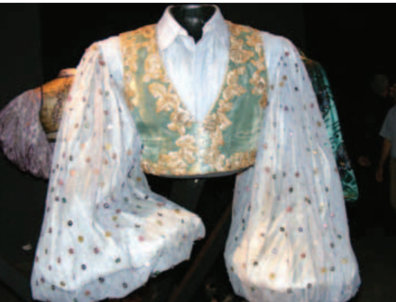
Una de las blusas de fantasía del cantante.

La premisa básica de esta muestra, que se ha ido presentando en ciudades emblemáticas y de referencia en la carrera