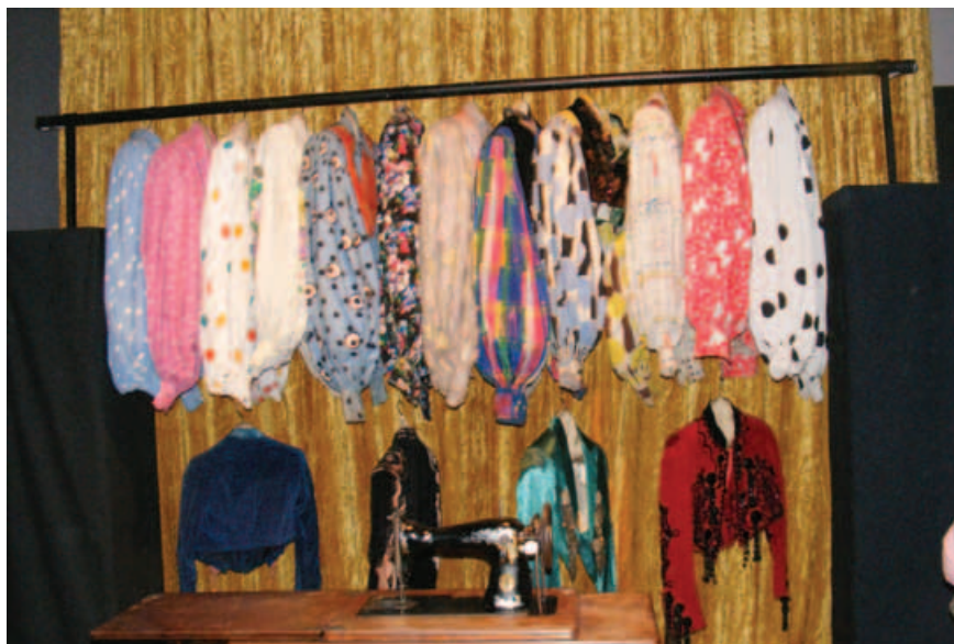
Izda. La maquina de coser del artista y un muestrario de blusas. Dcha. Retrato de Miguel de Molina.