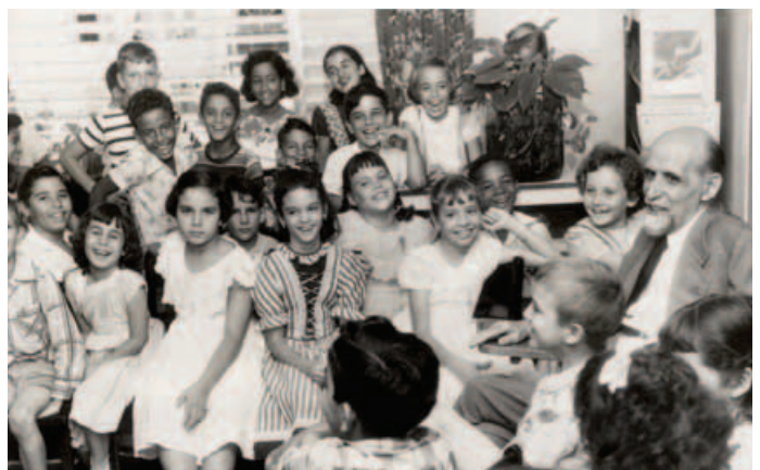
Juan Ramón Jiménez con un grupo de niños en Puerto Rico. Años 50.