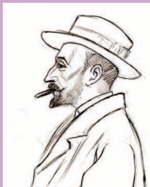
Retrato de Jacinto Benavente.

Es sabida la querencia del egregio D. Miguel de Unamuno por diversas disciplinas aparte de la literatura, la filosofía y el ensayo político. Fue también aficionado a la papiroflexia (o “cocotología” como el la llamó) y al dibujo. Ahora la Universidad de Salamanca, de la que fue famoso rector ha recogido algunos de sus excelentes dibujos en una exposición montada en el Patio de las Escuelas Menores. Son sobre todo sencillos apuntes a lápiz o carbón de familiares, amigos y rincones de la ciudad castellana en los que nos muestra lo que le era más íntimo y próximo.