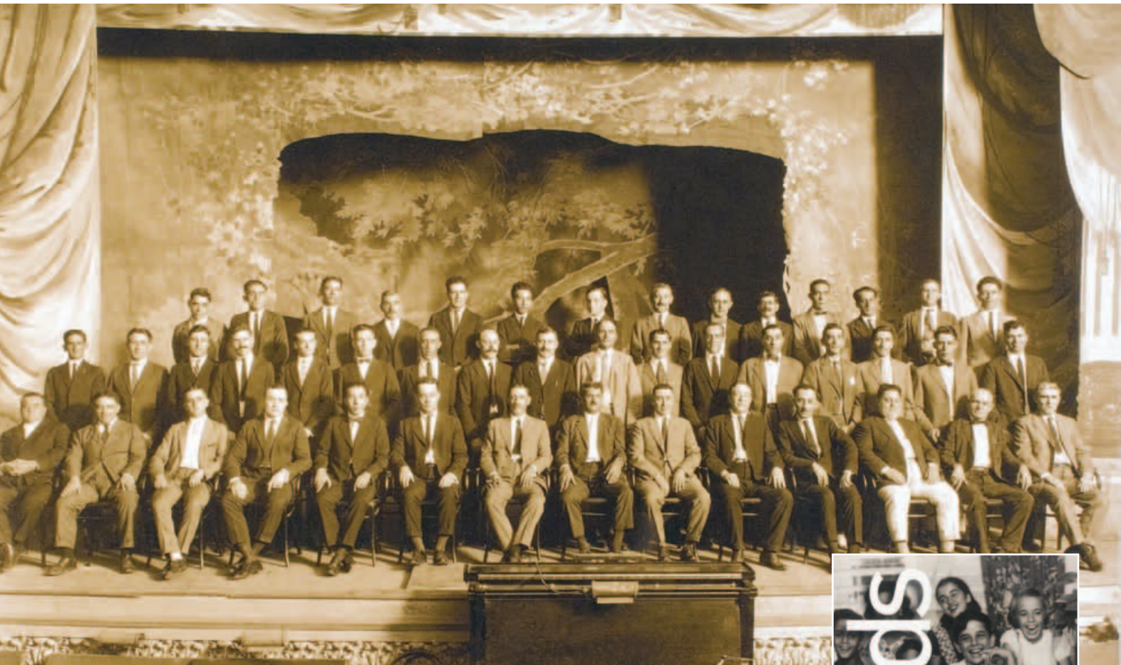
Junta Directiva del Centro Asturiano de Tampa (USA). 1927.