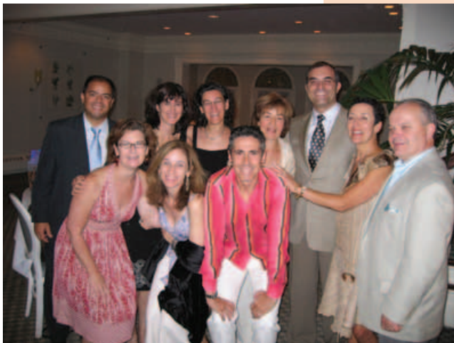
Miembros de la Asociación Cultural Española.

Los nombres de Ponce de León, Hernández de Soto, Vázquez Coronado o Fray Junípero Serra, aún siendo los más conocidos, apenas ocupan un renglón a pie de