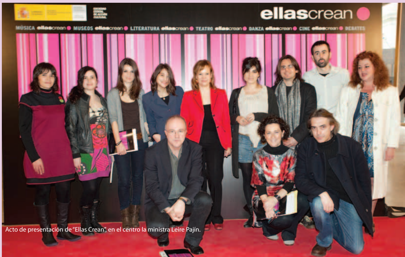
Acto de presentación de "Ellas Crean", en el centro la ministra Leire Pajín.

Como novedades, "Ellas Crean" 2011 ha reunido por vez primera en su historia en una misma acción cultural conjunta a cuatro grandes museos españoles –Prado, Thyssen, Reina Sofía y Lázaro Galdiano–, así como por vez primera desarrollará actividades en distintos centros penitenciarios del país. Otras claves de su séptima edición serán la celebración del segundo festival Eurojazz y la consolidación de su oferta internacional, a