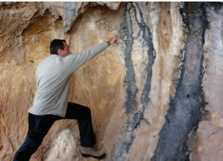
En la Cova el guía señala los dibujos que luego se pueden observar cómodamente en la reproducción del Museo de la Valltorta.