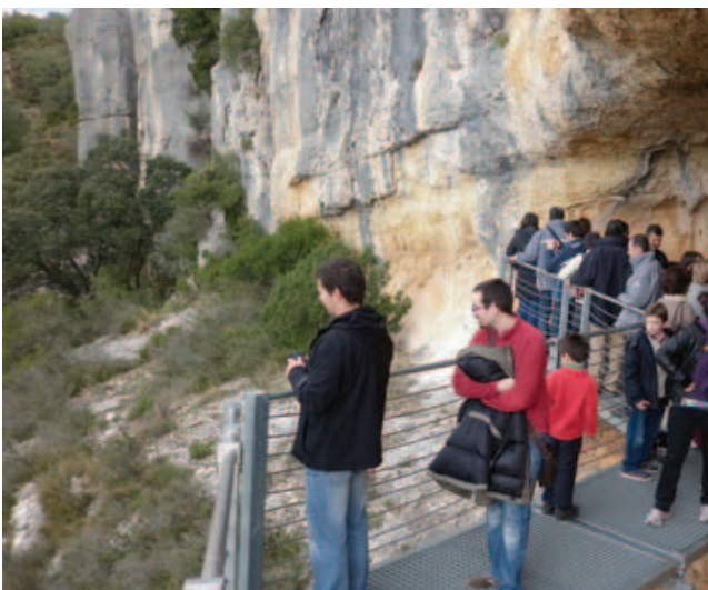
Los visitantes tratan de imaginar el lugar hace 4.500 años y las explicaciones del museo le ayudan a ello.