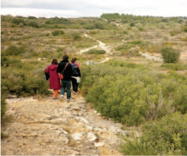
Al barranco se llega desde arriba, ofreciendo una vista impresionante, y una estrecha garganta baja hasta las pinturas.