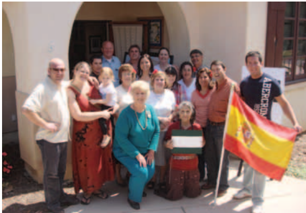
▲ Salida del aeropuerto de Barajas de un grupo de pastores vascos, contratados por el gobierno de los Estados Unidos. Junio de 1951. (Efe).