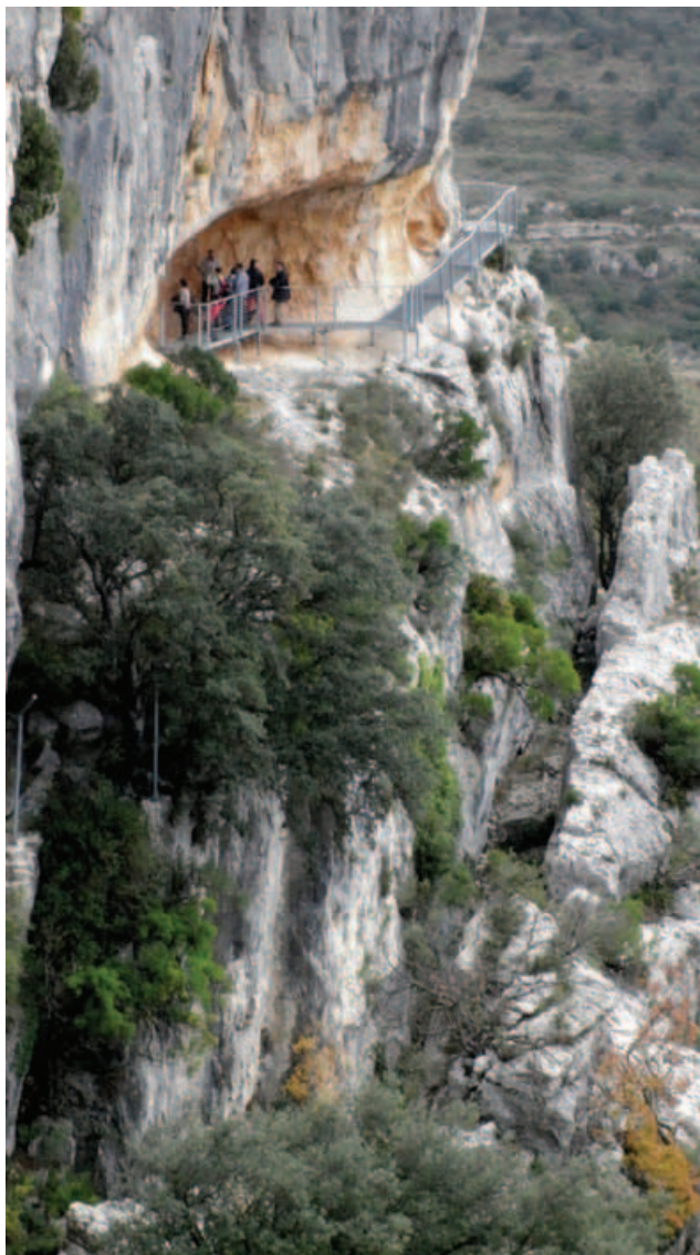
Una estrecha pasarela metálica permite el acceso seguro a la Cova.

En la actualidad un profesional, instruido en la prehistoria y con don de gentes, guía al grupo de visitantes curiosos hasta el mismo borde del barranco, un grandioso cañón de 20 kilómetros de largo con forma de herradura y paredes de 80 metros de altura, por cuyo fondo corre un riachuelo de temporada al que bajan a beber las cabras monteses. A distintas alturas pueden contemplarse las concavidades de la roca que forman los "abrigos". Para llegar a la Cova dels Cavalls, llamada así por interpretar sus descubridores que las figuras de cuadrúpedos representaban caballos, hay que bordear la cornisa, atravesar un estrecho desfiladero, una reja para la contención de los expoliadores