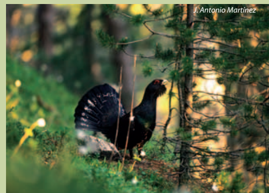
El urogallo es un ave habitual de algunos bosques.