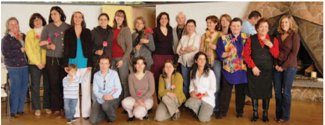
Grupo de mujeres españolas de Seattle el día de la madre.

Tras la II Guerra Mundial, los flujos migratorios de España a EEUU se revitalizaron y desde entonces se han alcanzado los 75.000 ciudadanos españoles inscritos como residentes en el año 2010.