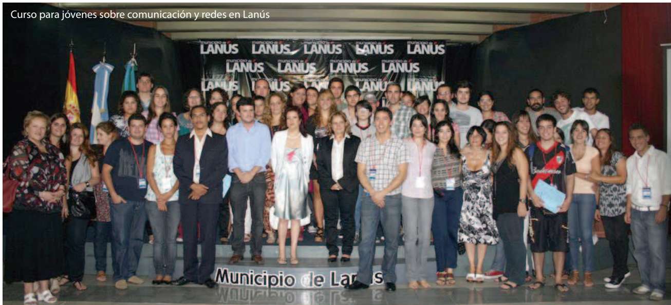
Curso para jóvenes sobre comunicación y redes en Lanús