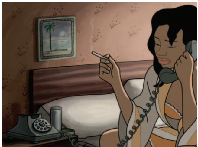
Música y amores, amores y música, ingredientes de bolero y de "Chico y Rita".