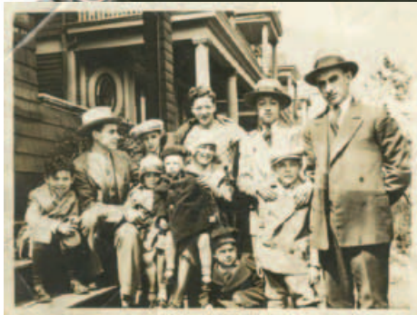
▲ Ambulancia del Club Obrero Español de New York. Años 30.