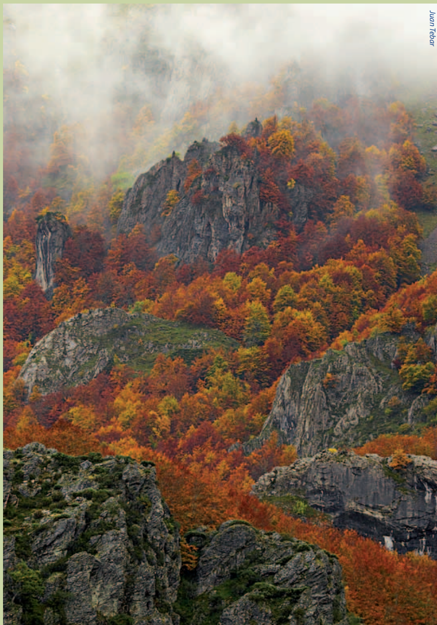
Robles, hayas y abedules en Muniellos (Asturias). A la derecha castañas recién caídas.

la organización ecologista Greenpace, en la actualidad sólo se conserva el 20 por ciento de los bosques vírgenes originarios y otro 20 por ciento corre serio peligro de desaparición. Centrándonos en España, la mitad de la superficie forestal se ha desarbolado y la acción del hombre amenaza seriamente la calidad biológica de los bosques que han logrado pervivir. La amenaza es muy seria y debería alertar a los gobernantes, ya que 1.600 millones de personas de los países más pobres sobreviven gracias a los alimentos, los materiales, el agua y