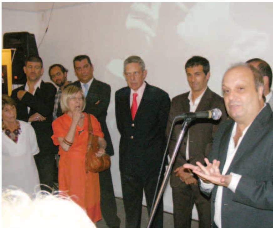
El sobrino de Miguel de Molina presenta la exposición.