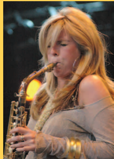
Candy Dulfer, saxofonista holandesa.