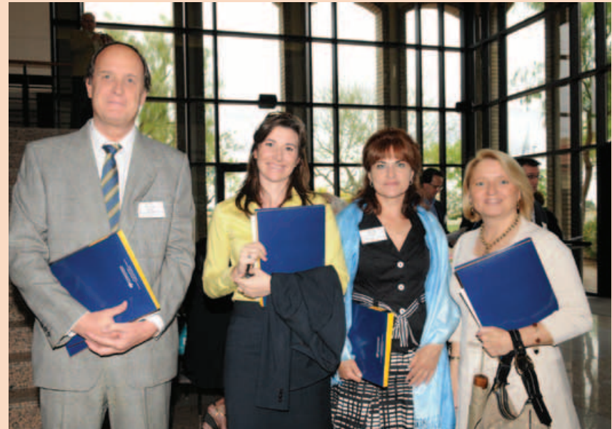
Licenciados y doctores españoles en EE.UU. (ALDEEU)