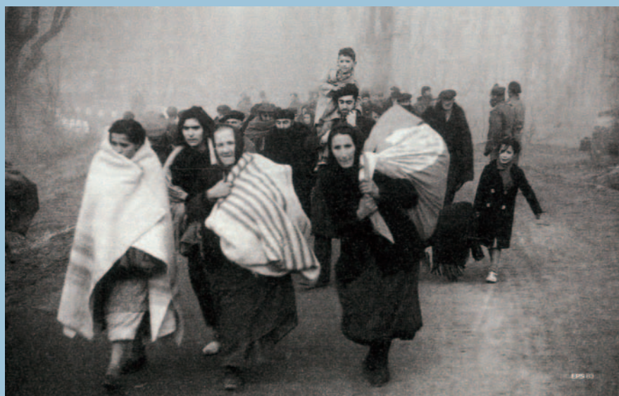
Los desastres de la guerra.

Se ha dicho de él que es el Robert Capa español, pero como todas las simplificaciones, también ésta es inexacta. Ni la cultura, ni la formación, ni el carácter de los dos fotógrafos eran iguales, ni lo eran tampoco las motivaciones éticas de su trabajo. Una monumental exposición inaugurada recientemente en Barcelona nos muestra la evolución de la obra de Agustí Centelles (Valencia, 1909-Barcelona, 1985), desde sus años de formación hasta su madurez, en pleno franquismo. Entre medias, sus memorables estampas de la guerra civil, conservadas clandestinamente en un pequeño pueblo francés y rescatadas en 1976, cuando ya el dictador se había convertido en polvo, bajo las berroqueñas piedras del Valle de los Caídos. Una selección de sus fotografías se muestra ahora en el Palacio de la Virreina de Barcelona, en una espléndida exposición.