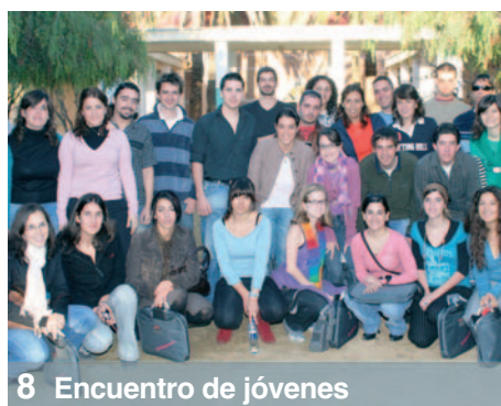
8 Encuentro de jóvenes