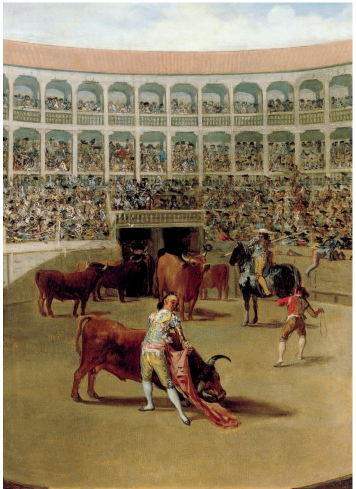
Goya. Pase de capa. 1793.