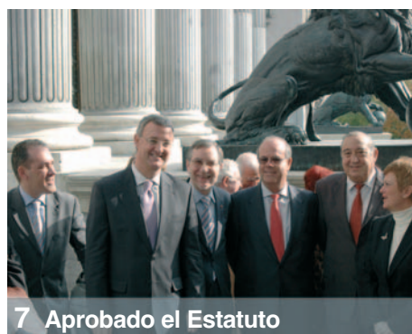
7 Aprobado el Estatuto

Carta de España autoriza la reproducción de sus contenidos siempre que se cite la procedencia. No se devolverán originales no solicitados ni se mantendrá correspondencia sobre los mismos. Las colaboraciones firmadas expresan la opinión de sus autores y no suponen una identidad de criterios con los mantenidos por la revista.