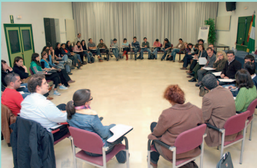
La mesa redonda con representantes de la Administración fue ágil y sustanciosa.

E l Encuentro de Jóvenes Españoles en el Exterior celebrado la última semana de noviembre en Mollina (Málaga) reunió a treinta y dos personas entre 18 y 30 años, de los cuales 13 estaban entre los 18 y los 21 años, 4 entre 21 y 24 años y 15 entre 24 y 30 años. En honor a la paridad fueron 16 mujeres y 16 hombres. Procedían de seis países europeos (Alemania, Bélgica, Francia, Luxemburgo, Reino Unido y Suiza) y de cinco países americanos (Argentina, Brasil, México Uruguay y Venezuela) además de un cooperante y un retornado residentes en España. En cuanto a su dedicación quince eran estudiantes, otros quince trabajadores en activo además de un cooperante y un desempleado.