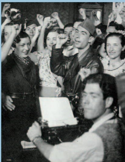
Boda de milicianos. Barcelona, 1937.