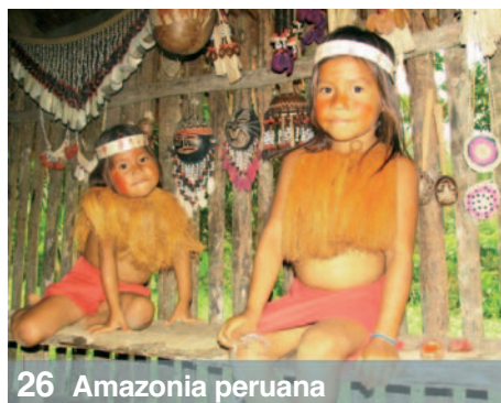
26 Amazonia peruana