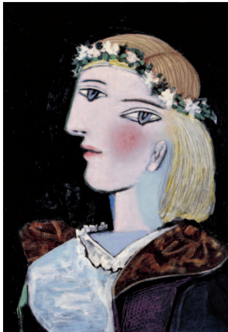
Picasso. Retrato de Marie-Thérèse. 1937.