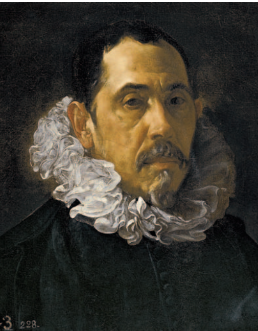
Velázquez. Francisco Pacheco. Hacia 1620.