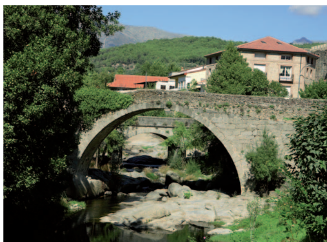
El puente "romano" o de Aquelcabo.