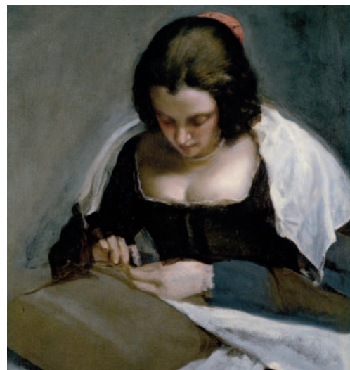
Velázquez. La costurera. Hacia 1640.