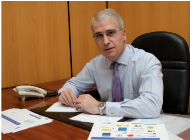
“Representamos el futuro de España, que es el de tener más y más presencia fuera.”

Lo que pasa a continuación y eso es la buena noticia, es que se trae a España personal cualificado del país donde se ha establecido la empresa española, porque lo que se quiere es que se produzca una diversidad cul-