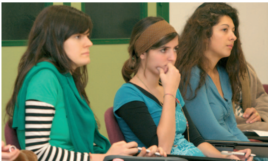
Hubo una leve mayoría de mujeres sobre hombres: 17 sobre 15.

ceso de equiparación de diplomaturas al Bachelor Degree.