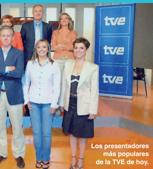
Los presentadores más populares de la TVE de hoy.

perar la democracia. Esa Transición, realizada como se pudo, con más de 200 asesinatos políticos, culminaría con un golpe de estado encabezado por el espectral guardia civil bigotudo Antonio Tejero, el 23 de febrero de 1981, cuando secuestró al Parlamento español. TVE dio las imágenes a España y al mundo de ese golpe militar violento y ridículo, tercermundista.