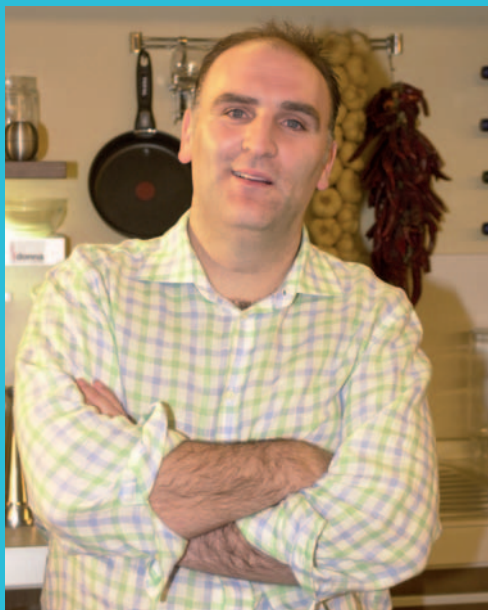
Los programas de cocina con José Andrés son más programas.