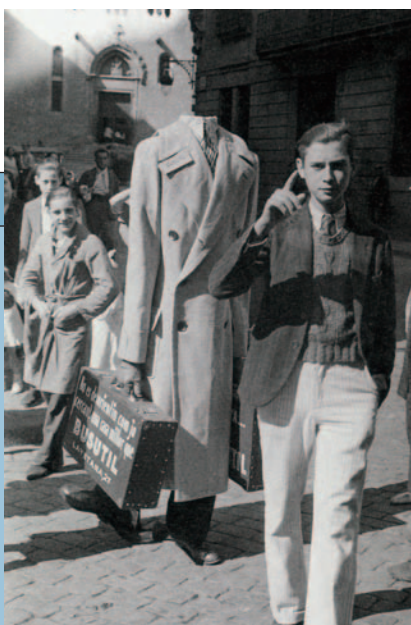
Hombre anuncio. Barcelona, 1935.