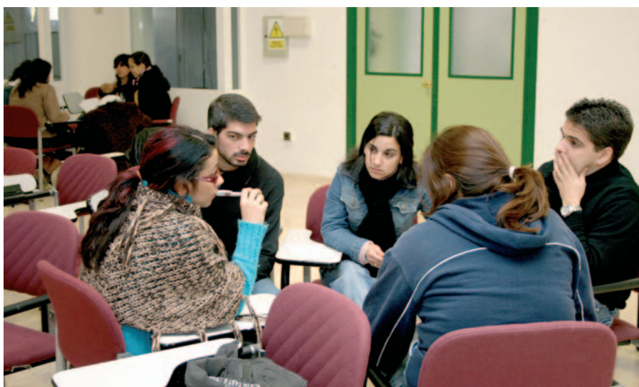
Reunión de grupos de debate sobre los distintos temas propuestos.

Se apuesta por posibilitar y fomentar el acceso a la cultura y, especialmente, a la lengua española de todos los residentes en el exterior, así como facilitar la movilidad laboral y educativa a los procedentes de sistemas educativos de tipo profesional. Se solicita el establecimiento de becas para estancias en prácticas de lenguas extranjeras, dirigidas a quienes residen en países que no fomentan los aprendizajes de estas materias en sus sistemas públicos. Se propone facilitar el acceso a los programas de becas existentes en España y acelerar el pro-