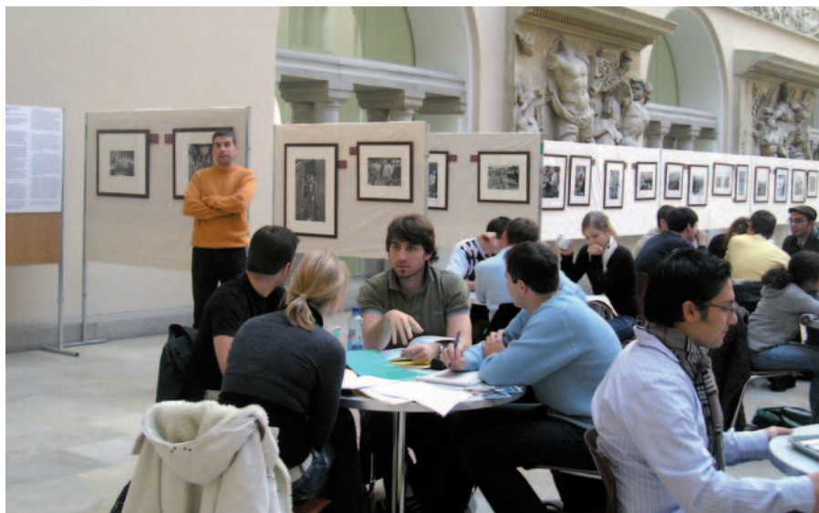
Dos aspectos de la exposición en la Universidad de Zurich.