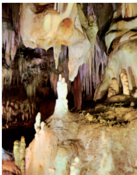
Interior de las Cuevas del Águila.