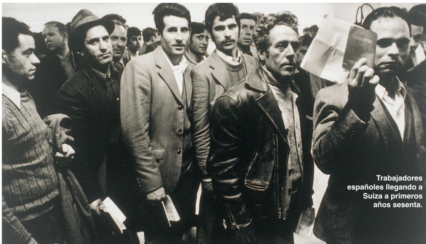
Trabajadores españoles llegando a Suiza a primeros años sesenta.

La exposición, realizada por el equipo de la revista Carta de España, recoge en imágenes el cúmulo de desgarros sociales y sentimentales que supone un fenómeno tan dramático como la emigración. Y, para su realización se han consultado docenas de archivos fotográficos, fondos de museos, fundaciones, revistas, sin olvidar las colecciones particulares. Destaca la presencia de fondos de la Fundación Archivo de Indianos de Colombres, el Museo del Pueblo de Asturias, la Agencia EFE, la