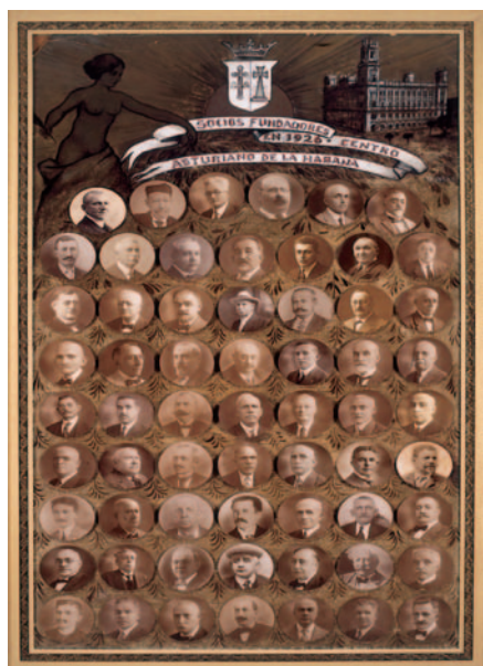
Socios fundadores del Centro Asturiano en La Habana. 1926.