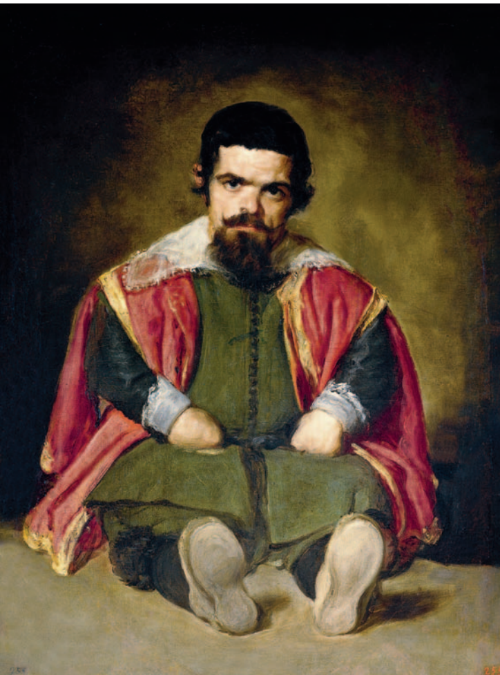
Velázquez . Don Sebastián de Morra. Hacia 1660.