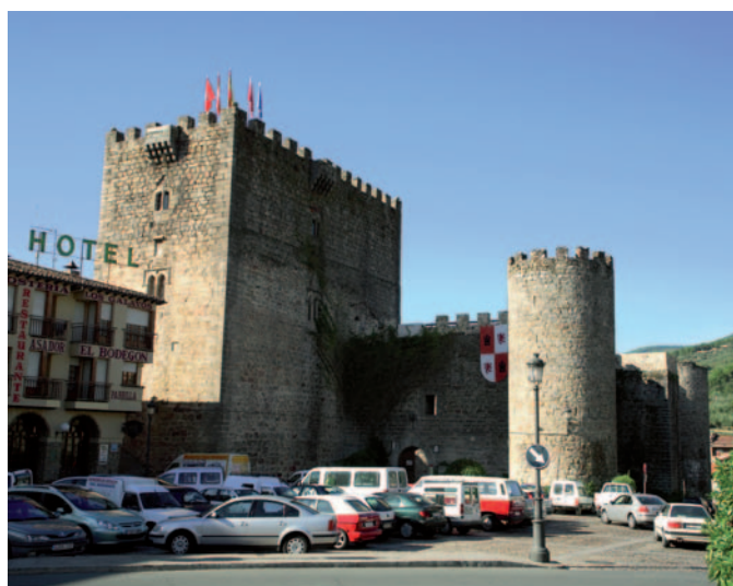
El Castillo de la Triste Condesa, cuyo interior se visita desde junio.