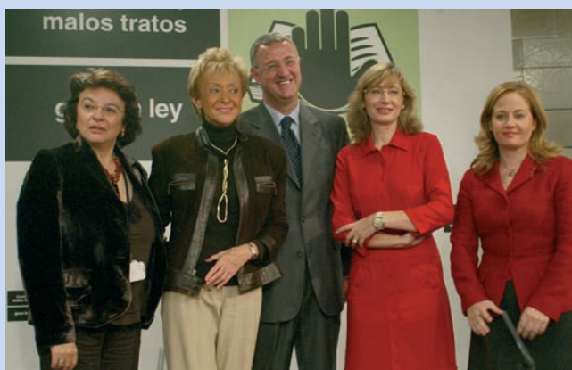
Presentación de la campaña contra los malos tratos.

Formando parte de esa presión en todo el campo que se intenta ejercer desde los poderes públicos, en la Campaña han participado la Secretaría General de Políticas de Igualdad, la Delegación Especial del Gobierno contra la Violencia sobre la Mujer, la Dirección General del Instituto de la Mujer, la Liga de Fútbol Profesional y el Consejo Superior de Deportes, junto con otros organismos públicos y privados. Entre sus actos destaca una exposición en el Círculo de Bellas Artes titulada