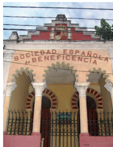
A la izquierda, barcos en el Amazonas. Arriba, fachada de la Sociedad Española de Beneficencia.

la única geografía donde se podían encontrar las especies vegetales para la manufactura del látex fuera la región amazónica. El caucho, jebe o “siringa” se obtenía haciendo incisiones en el árbol Hevea Brasiliensis para luego recoger la goma destilada en gruesos fardos pringosos.