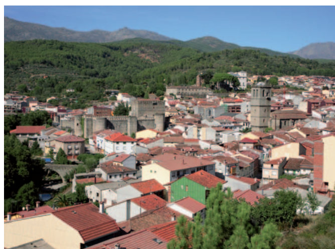
Vista de Arenas con el Castillo, la Iglesia y, al fondo, el Palacio de la Mosquera.