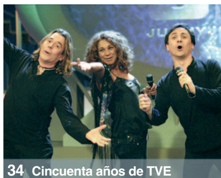
34 Cincuenta años de TVE