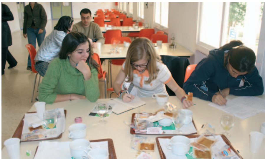
Se compaginó la redacción de conclusiones con el desayuno.

ron ver la mayor población de flamencos rosas de España y a la ciudad de Antequera, muy próxima al CEULAJ de Mollina, y que es quizá la ciudad más monumental de Andalucía tras Sevilla, Córdoba y Granada.