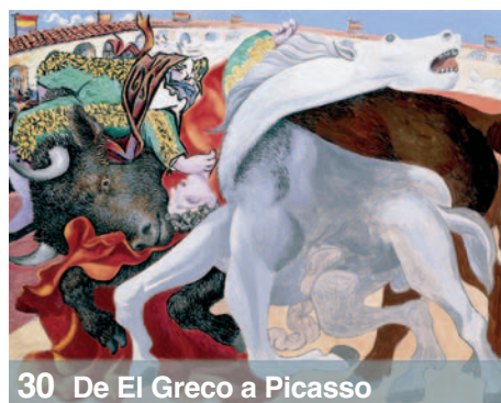
30 De El Greco a Picasso