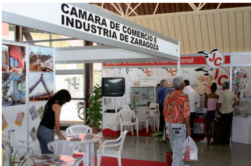
Aspecto de la Feria Internacional de La Habana en la que España fue el segundo país con más empresas.

Doce años apoyando a las empresas españolas. A doce años de crea-