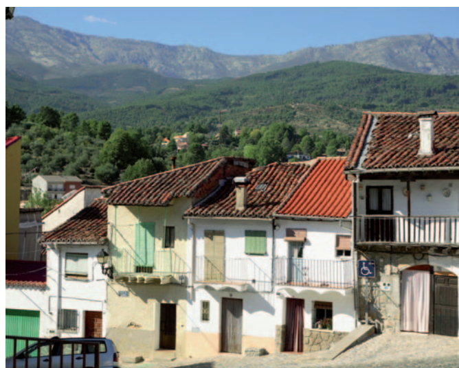
Calle típica del barrio del Canchal.