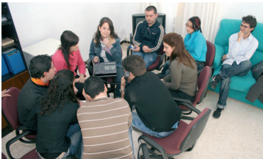
Algunos jóvenes en una entrevista colectiva para Radio Exterior de España.

ciaciones o clubes con actitudes pro-activas a favor de los jóvenes y capacitar a éstos españoles del exterior para el fomento del asociacionismo