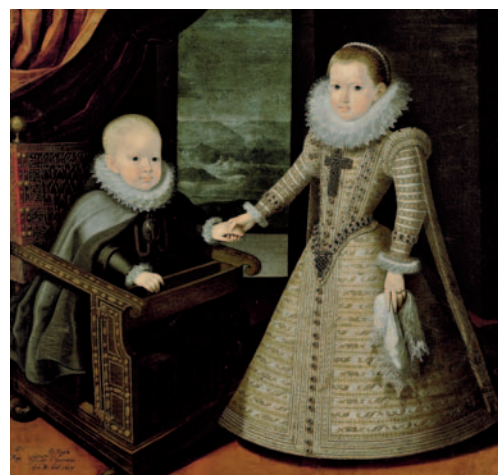
Pantoja de la Cruz. Los infantes don Felipe y doña Ana. 1607.