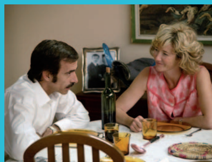
Los Alcántara, de "Cuéntame..." la serie actual más popular de TVE.

rias para no dormir" o el divertido "Un, dos tres", concurso donde mezclaba concursos: saber, habilidad, música... También forma parte del mito de TVE José Luis Balbín y su programa político de opinión "La Clave", eliminado de la parrilla por demasiado libre... Mítica sería también la serie "Verano azul", con el insufrible "Chanquete" y su pandilla playera de adolescentes.