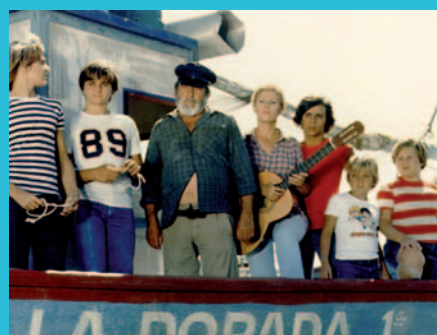
"Verano Azul". Media España estaba pendiente de sus andanzas.

TVE ha tenido que adaptarse a los nuevos tiempos, disfrutando y soportan-