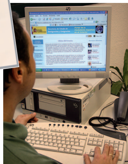
Consuelo Rumí, secretaria de Estado de Inmigración y Emigración, presentó la Guía que también se puede consultar en Internet.