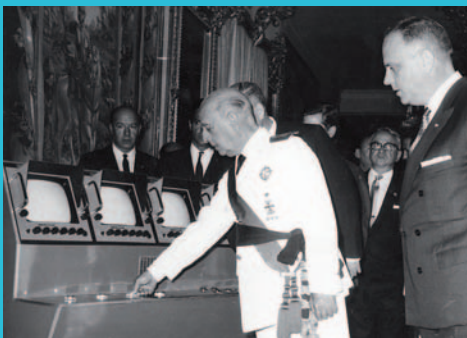
Franco inaugurando los estudios de Prado del Rey, 1974, junto a Manuel Fraga Iribarne.

mado ” a los españoles de la visita del presidente de EEUU, general Eisenhower, a España (1959) y su abrazo con el dictador Franco (USA validaba la dictadura más brutal de Europa occidental); o de la llegada del primer hombre a la Luna (1969). Televisión Española también informaría, en la medida en que en aquella época de brutal censura se podía, de la revolución portuguesa de los claveles (Carlos Arias Navarro y seis ministros vieron en privado el desmoronamiento de la dictadura de Salazar, en un reportaje de dos horas). Y un