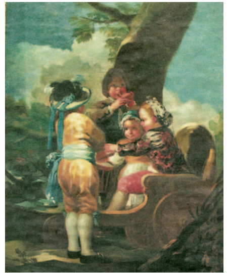
Goya. Niños del carretón, 1779. Esta obra se benefició de un alud de inesperada publicidad al ser robada unos días antes de abrirse la exposición. Una semana después fue recuperada por el FBI.