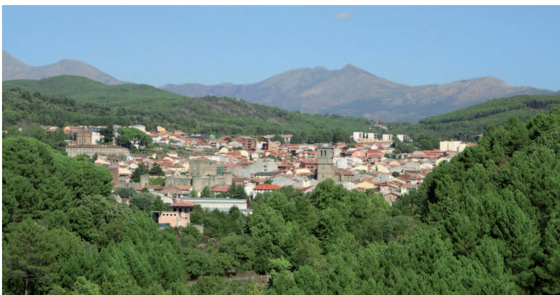
Vista general de Arenas de San Pedro.

monumentos y calles, recuperados de los destrozos que en el siglo XIX sufrieron de manos de los franceses y por los enfrentamientos carlistas. Uno de esos monumentos, el palacio de la Mosquera, del Infante Borbón, se prepara para ser reutilizado como Hospedería Real.