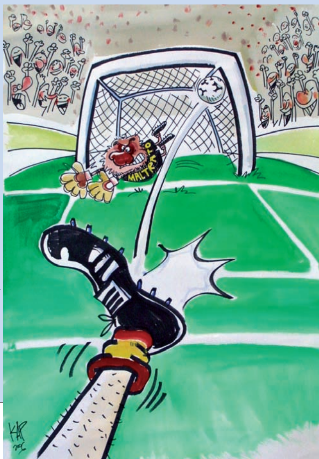
Ilustración de Jaume Capdevila.

han plasmado en sus dibujos ideas contra esta violencia doméstica. Se han sucedido los anuncios en prensa, radio y televisión y se han llevado a cabo talleres para los colegios y para las familias, pues la concienciación social empieza por el entorno más cercano y la educación ha de compensar el mal ejemplo que