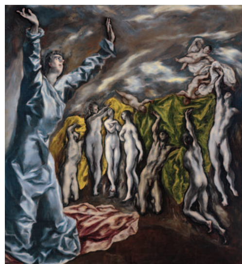
El Greco. Visión de san Juan. Hacia 1610.